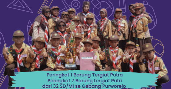
Peringkat 1 Barung Tergiat Putra Peringkat 7 Barung tergiat Putri dari 32 SD/MI se Gebang Purworejo